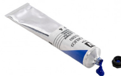
PINTURA DE ÓLEO