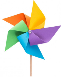
MOLINILLO DE VIENTO