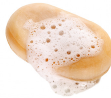
PASTILLA DE JABÓN