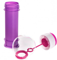
BOTE DE BURBUJAS