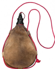
BOTA DE VINO